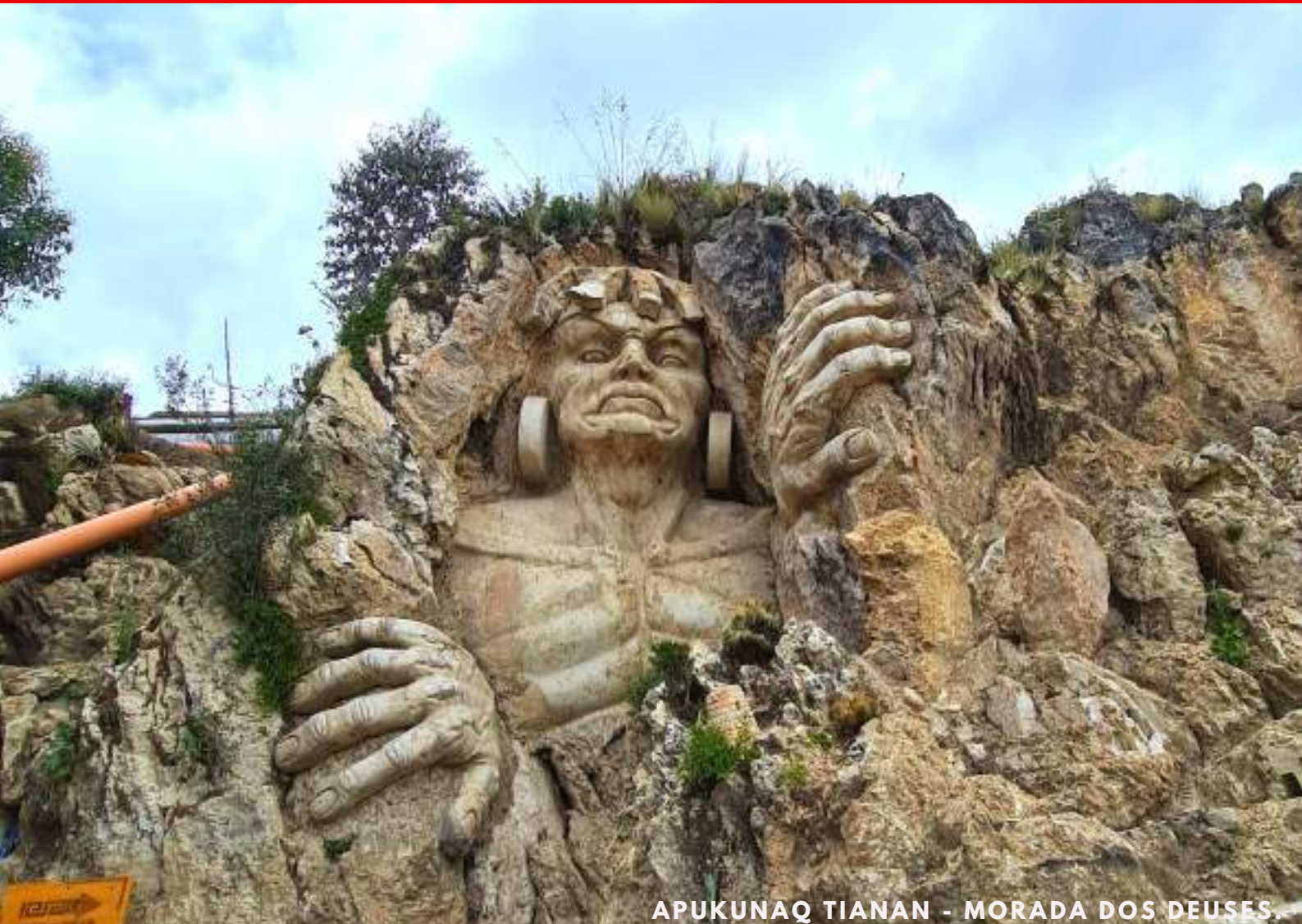
APUKUNAQ TIANAN - MORADA DOS DEUSES.